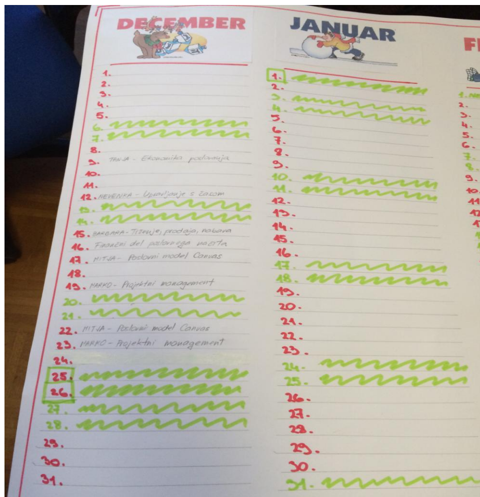
Plan usposabljanj in svetovanj zunanjih izvajalcev za mesec december.

Na temo Trženje pa smo bili deležni različnih svetovanj, več strokovnjakov nam je svetovalo pri razumevanju in uporabi naslednjih tem: motivacija in vpliv človeških virov na področju trženja, trženje (marketing, prodaja, nabava), projektni management v funkciji trženja in upravljanje s časom ter pogajanja in lobiranje.